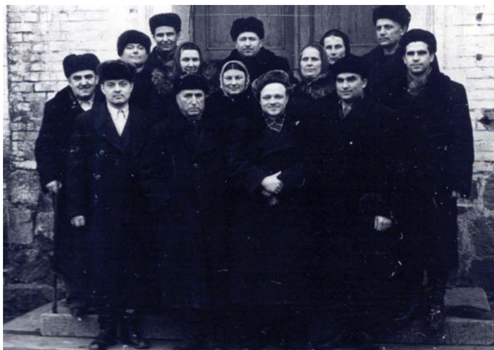
Мироновка перед отъездов в ТСХА.