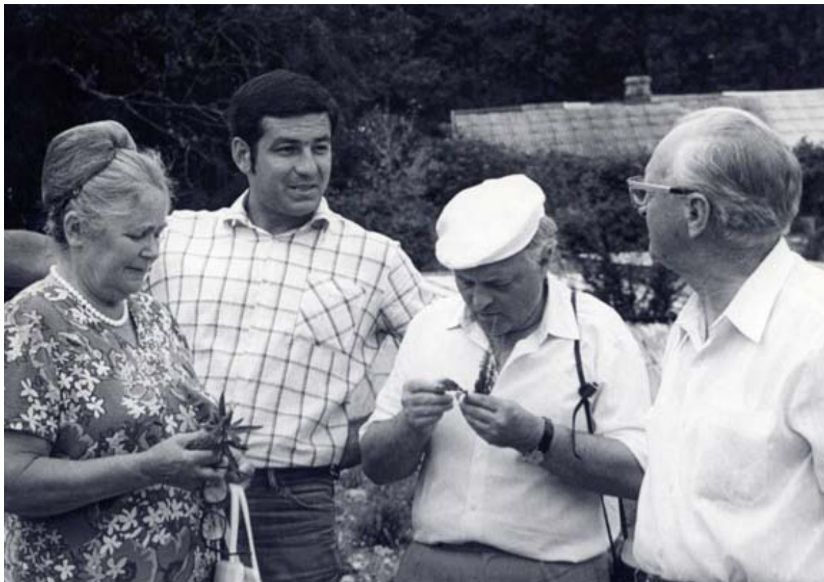
Никитский ботанический сад.