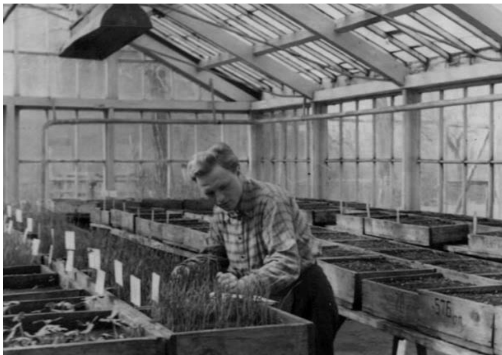
Аспирантура в ТСХА.

Среднюю школу окончил в Москве и в 1952 году поступил в Московскую сельскохозяйственную академию им. К.А. Тимирязева, на отделение селекции и семеноводства, которую окончил с