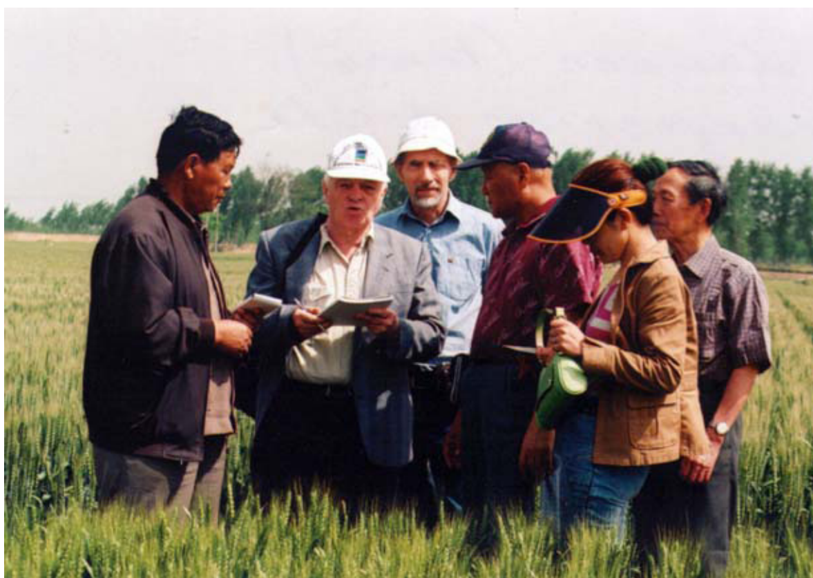
С коллегами КНР.