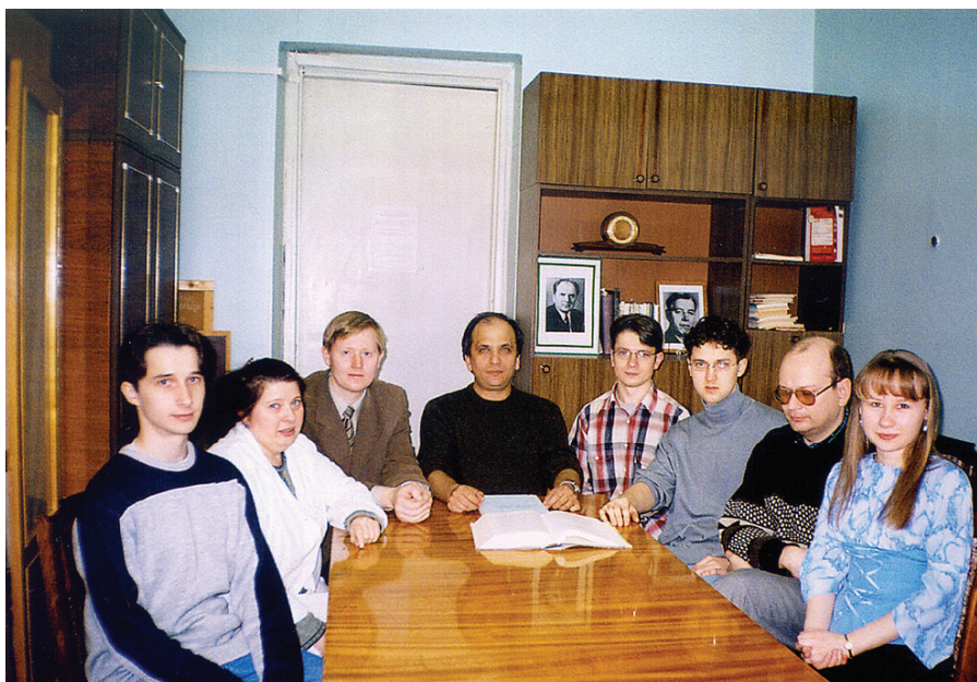
Рис. 4. Лаборатория радиационной генетики. 2005 г.

излучений, заключающийся в анализе характеристик продолжительности жизни у облученных особей с модифицированными генотипами (нокаут, сверхэкспрессия) (Москалев, 2008). Были изучены генетические механизмы радиационного гормезиса и радиоадаптации, в которых в качестве фенотипического признака анализиру-