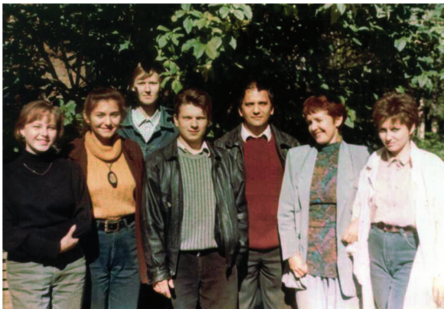
Рис. 3. Генетики отдела радиоэкологии Института биологии Коми НЦ УрО РАН. 1996 г.