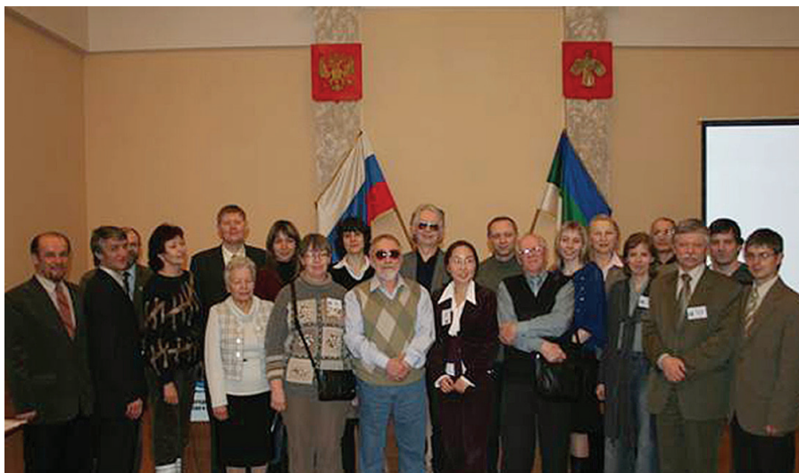
Рис. 6. 25–26 марта 2008 г. в Институте биологии Коми НЦ УрО РАН (Сыктывкар) прошел первый Всероссийский семинар «Генетика продолжительности жизни и старения».

Продолжительность жизни является интегральным показателем приспособленности, который в отсутствие несовместимых с жизнью внешних воздействий определяется скоростью старения организма. Наследственная составляющая продолжительности жизни составляет около 25%. Темпы старения организма определяются его