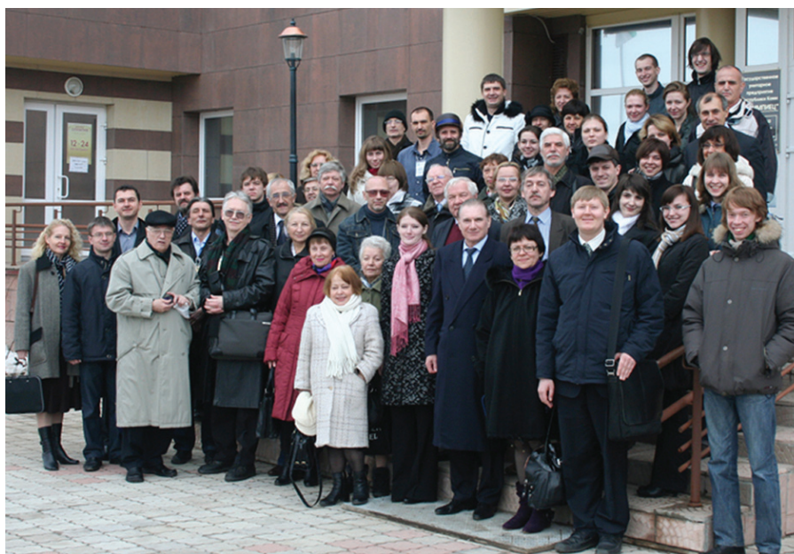
Рис. 7. I-я Международная конференция генетика продолжительности жизни и старения (Сыктывкар, Республика Коми, 12–15 апреля 2010 г.).

транслокации, анеуплоидия) и эпигенетических изменений, что является причиной нарушения экспрессии генов и деления клеток, апоптоза, и, в конечном итоге, фактором риска для возникновения возраст-зависимых заболеваний (Moskalev et al., 2013; Moskalev et al., 2014a; Velegzhaninov et al., 2015).