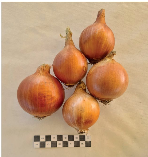
Рис. 1. F 1 (BC 2 (Benefit × Leon) × Elenka-DH 1)) Fig. 1. F 1 (BC 2 (Benefit × Leon) × Elenka-DH 1))