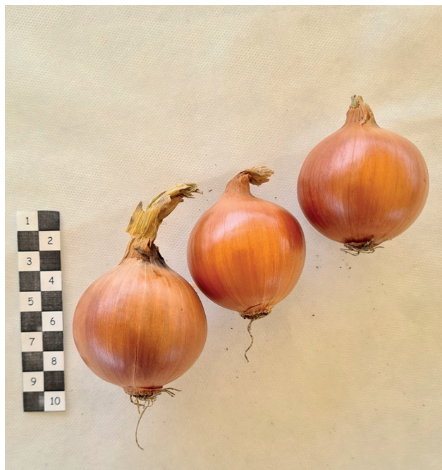
Рис. 2. F 1 (BC 2 (Katinka × Elenka) × Super nova-DH 6)) Fig. 2. F 1 (BC 2 (Katinka × Elenka) × Super nova-DH 6))